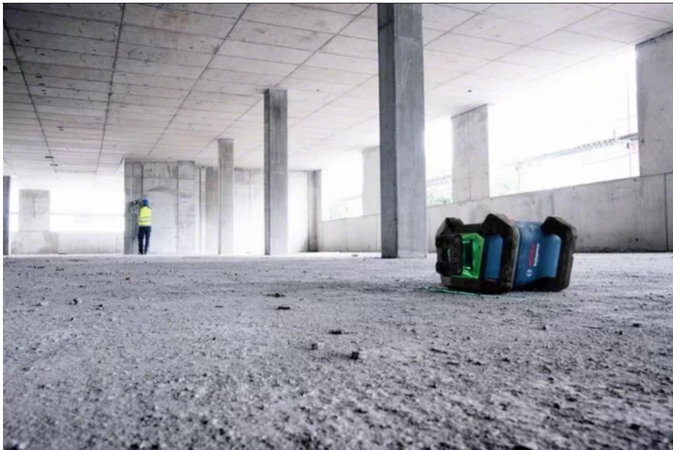
GRL 650 CHVG: laser obrotowy z zieloną wiązką i funkcją Bluetooth, do pracy w trudnych warunkach

Być może kiedyś będą lepsze narzędzia — teraz są tutaj.