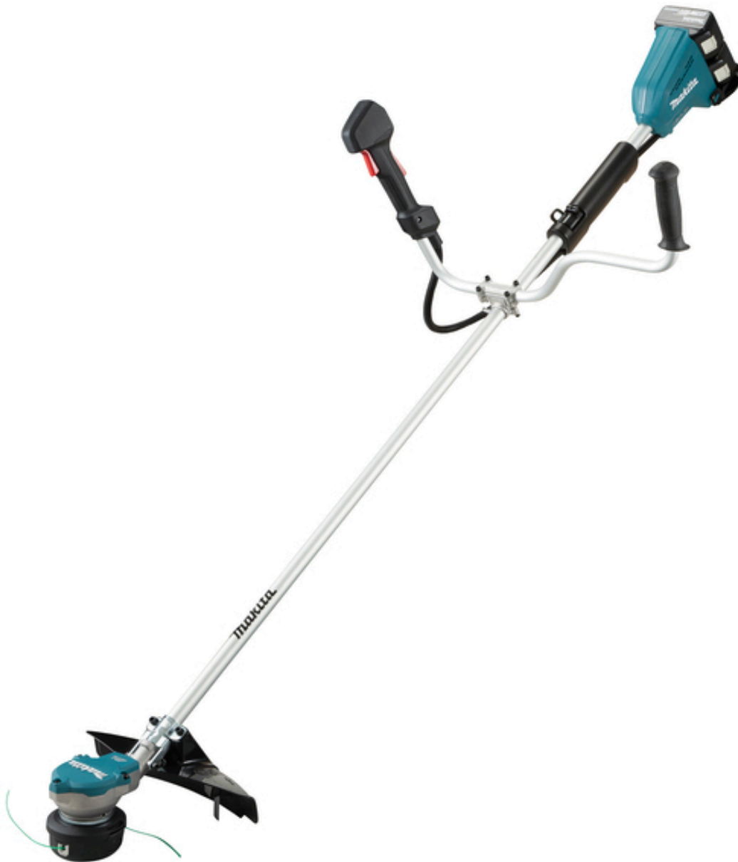
Kosa żyłkowa akumulatorowa 2x18V/5,0Ah + ładowarka DUR368APT2 Makita.