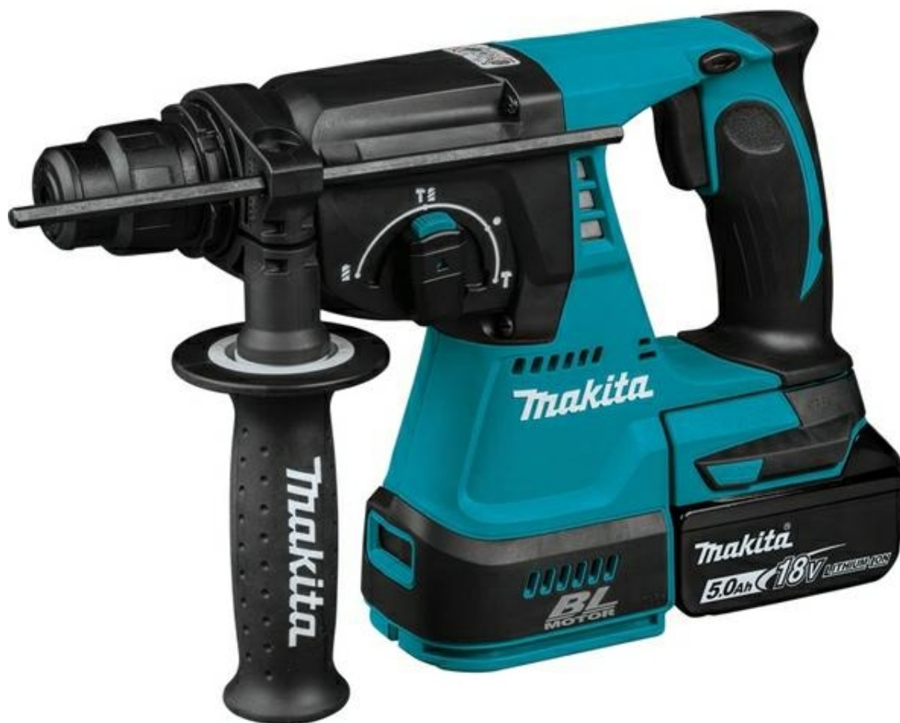
Młot wiertąco-kujący SDS-Plus 18V 2J 2 x 5,0Ah BLDC DHR242RTJ Makita