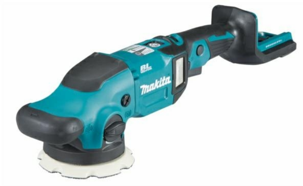
Polerka mimośrodowa akumulatorowa 18V 125mm DPO500Z Makita