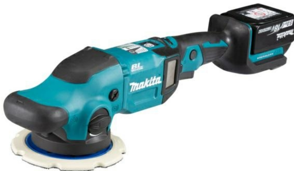
Polerka mimośrodowa akumulatorowa 18V 150mm 2x5Ah DPO600RTE Makita.