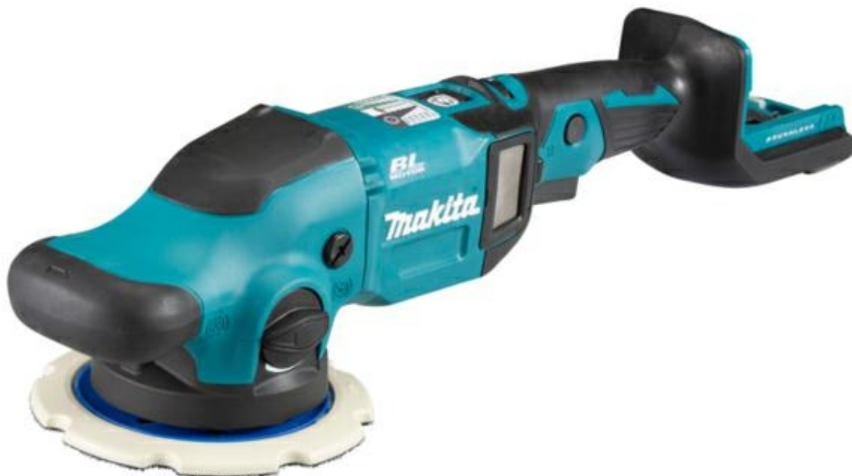
Polerka mimośrodowa akumulatorowa 18V 150mm DPO600Z Makita.